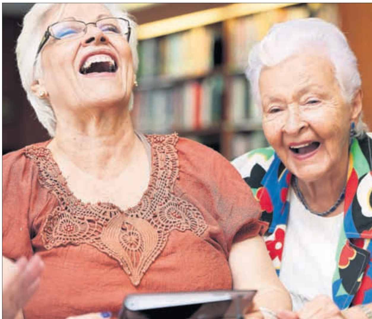
Kleine Dinge im Alltag erledigen oder etwas Zeit für einen Schwatz haben; auch ausserhalb der Pflege kann man Betagten helfen.

Grafik: Oliver Marx